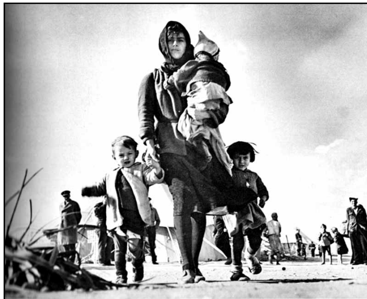
Srpska majka u logoru El Sat 1943.