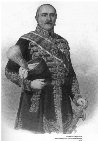
Knez Miloš Obrenović, litografija Anastasa Jovanovića, 1853.