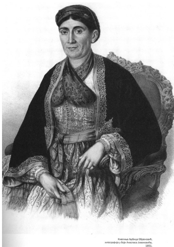
Kneginja Ljubica Obrenović, litografija Anstasa Jovanovića, 1851.

Iako je rođen u vrlo siromašnoj porodici, Miloš je postao najbogatiji čovek Balkana jer je državnu kasu proglasio svojom. „Miloš niti zna šta je od Boga greota, ni od ljudi sramota“, pisao je o njemu Sima Milutinović Sarajlija. Miloš je, međutim, smatrao da je bolje upravljati bez zakona jer „onako se čovek veže za artiju, pa ne može da čini ni zla ni dobra“. Knez je narod ubeđivao da je bolja „sirotinja