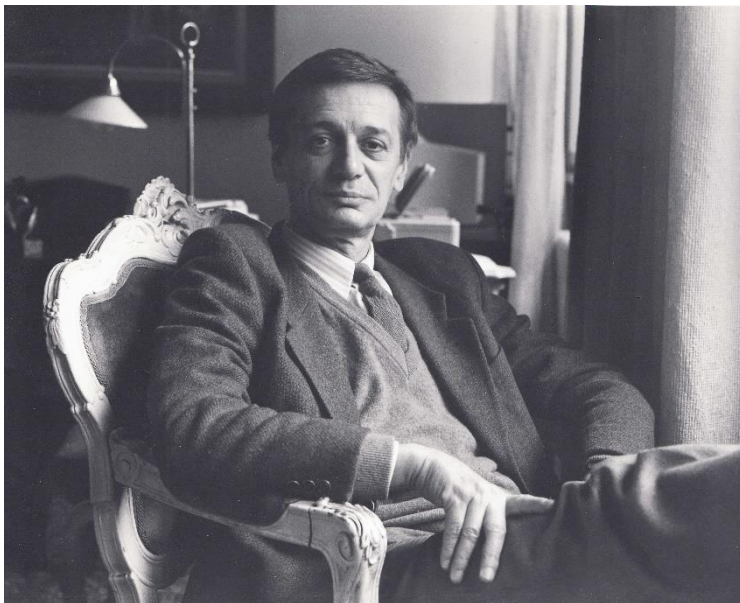
Jovan Ćirilov (Kikinda, 30. avgust 1931. – Beograd, 16. novembar 2014.)